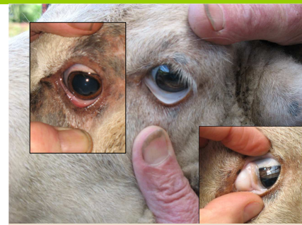
L'anémie - impliquant une muqueuse oculaire blanche -, un signe caractéristique de l'haemonchose.

Les larves survivent à l'hiver sur les pâtures. Le niveau d'infestation des prairies connaît deux pics d'augmentation, un premier lorsque les femelles sont en fin de gestation et excrètent davantage d'œufs du fait d'une perte de leur immunité, et un deuxième en été par l'excrétion d'œufs aussi bien par les adultes que par les jeunes.