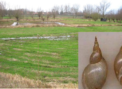
Les zones humides abritent les limnées, hôte intermédiaire de la douve.