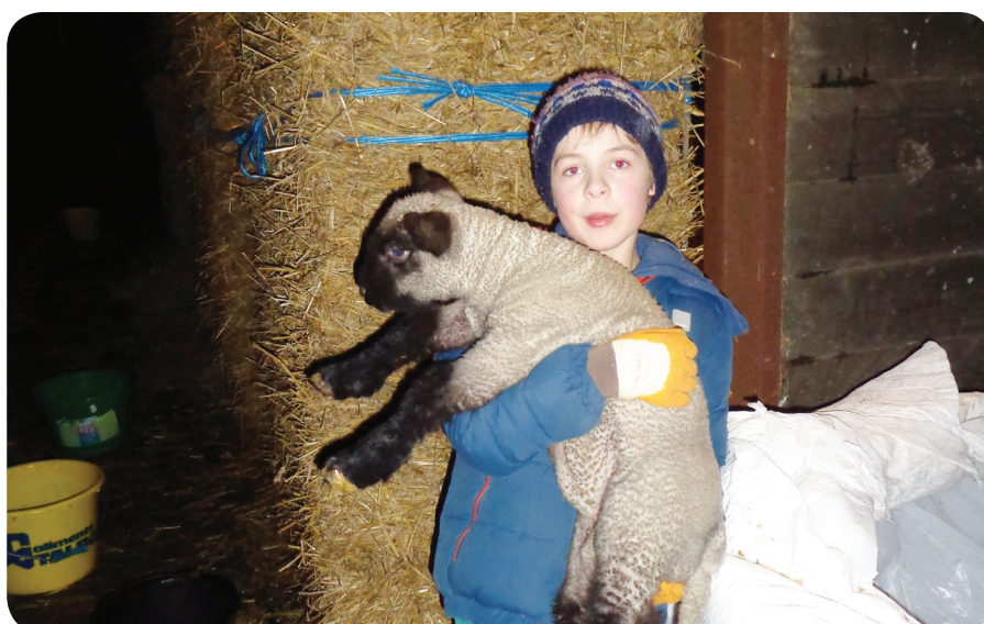
Pesée officielle réalisée par nos soins.

Cette première information est déjà très utile, mais toutefois il demeure difficile de