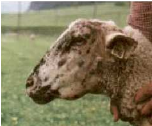
Oedème sous-glossien ou "signe de la bouteille"

Quelque 6 heures après leur ingestion, les larves L3 atteignent la caillette.